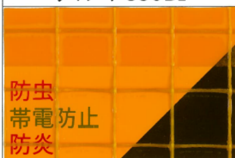
デルマ 350B 2