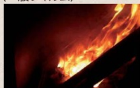
燃焼試験開始 15～20 秒後