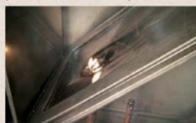
燃焼試験開始 15～20 秒後

〈アキレスフラーレ〉と一般塩化ビニールフィルムの燃焼比較試験を行ったところ、接炎後15～20秒で一般塩化ビニールフィルムは燃えているのに、〈アキレスフラーレ〉はまだ燃えていません。接炎後2分を経過してからも、一般塩化ビニールフィルムは大きな炎をあげて燃え広がっているのに対し、〈アキレスフラーレ〉は小さな炎が出ているにすぎません。火元を取り除くと延焼せずに自然に鎮火しました。ここに〈アキレスフラーレ〉の防災性と自己消火性が実証されました。但し、自己消火性とは火元がなくなったときに自ら鎮火するという意味であり、火の中では燃えますのでご注意ください。