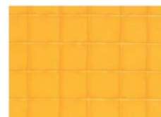
アキレス防虫フラーレイトイリ